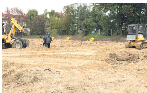
Boisko jeszcze w trakcie budowy.

Wartość inwestycji w ZSP to blisko 2 700 000 zł .