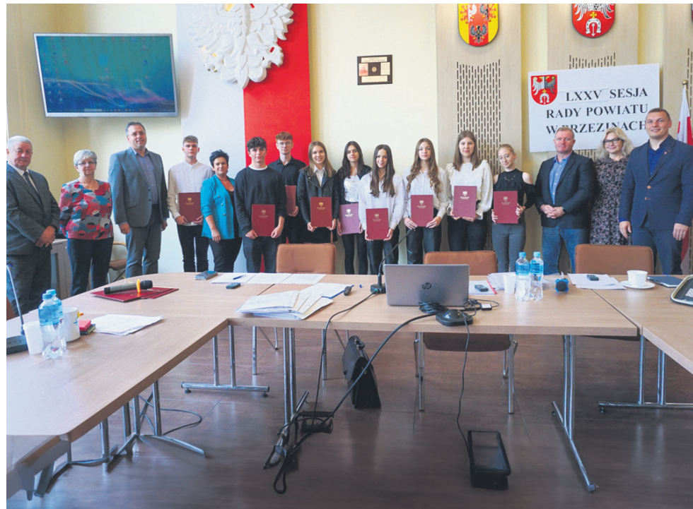
Podczas LXXV Sesji Rady Powiatu w Brzezinach wręczono „Stypendia Starosty” dla najzdolniejszych uczniów szkół średnich w Powiatu Brzezińskim.

powiatu brzezińskiego i pierwszą tego rodzaju placówką w województwie łódzkim.