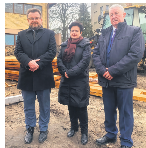
Konferencja prasowa nt. przebudowy terenu przy ul. Skłodowskiej. Na zdjęciu od lewej: Piotr Adamczyk, wicemarszałek województwa, Renata Kobiera, starosta brzeziński, Ryszard Śliwkiewicz, wicestarosta brzeziński.

I już na koniec wkrótce rozpocznie się remont ostatniego budynku na tzw. „dołku” przy ul. Skłodowskiej oraz terenu wokół. Zamontowane zostaną urządzenia do gier i zabaw dla mieszkańców powiatu. Po zakończonej modernizacji teren stanie miejscem zabaw i rekreacji dla całych rodzin. Wartość tej inwestycji to ponad 6 800 000 zł .