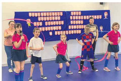
W szkole zmodernizowano m.in. salę sportowo-rekreacyjną.

W PZSiPO wyremontowano salę sportowo - rekreacyjną, utworzono plac zabaw, zakupiono urządzenia do terapii i rehabilitacji, wyposażono i zmodernizowano sale lekcyjne: przyrodniczą, pracownię gospodarstwa domowego, zakupiono drukarkę 3D i zmodernizowano windę. W tym roku powstanie ogród z altaną i ścieżką sensoryczną. Wartość inwestycji w PZSiPO to blisko 700 000 zł .