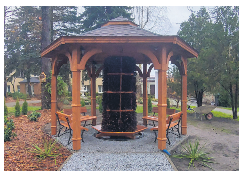
Tężnia w DPS.

W Domu Pomocy Społecznej w Brzezinach wiele się zmieniło. Otóż zaadaptowano poddasze na cele użytkowe, dobudowano klatkę schodową wraz z szybem windowym. Zakupiono także podnośniki i samochód do przewozu mieszkańców. Powstał również piękny ogród wraz z tężnią, ścieżką sensoryczną, fontanną. Wymieniono również kostkę brukową. Aktualnie rozpoczyna się remont instalacji w budynku i wymiana sprzętu w kuchni i pralni, remonty pomieszczeń oraz montaż fotowoltaiki. Wartość inwestycji w DPS to blisko 5 400 000 zł .