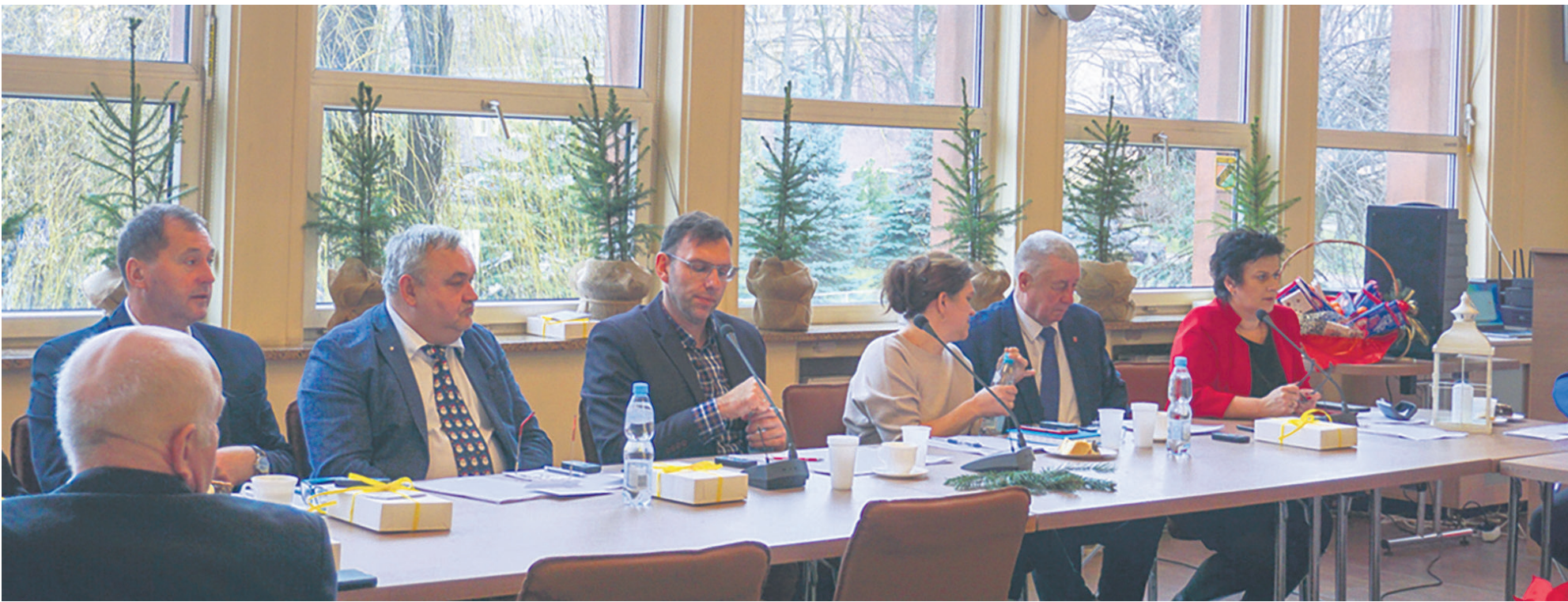
Obrazy Radnych Rady Powiatu w Brzezinach oraz Zarządu.

Otwarcie pierwszego w województwie łódzkim Centrum Opiekuńczo-Mieszkalnego w Dąbrowie , wyremontowane blisko 50 km dróg, remonty w szkołach, zmodernizowane boiska. Podsumujemy pięć lat RADY POWIATU W BRZEZINACH I ZARZĄDU .