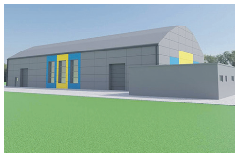
A tak może wyglądać zadaszenie boiska w liceum.