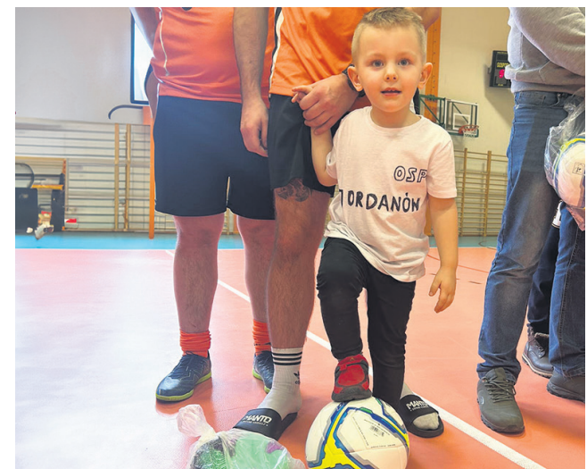
Za nami turniej piłki nożnej strażaków OSP Powiatu Brzezińskiego

Zarząd Powiatu w Brzezinach ogłosił otwarty konkurs ofert na realizację zadań publicznych Powiatu Brzezińskiego w roku 2024 przez organizacje pozarządowe.