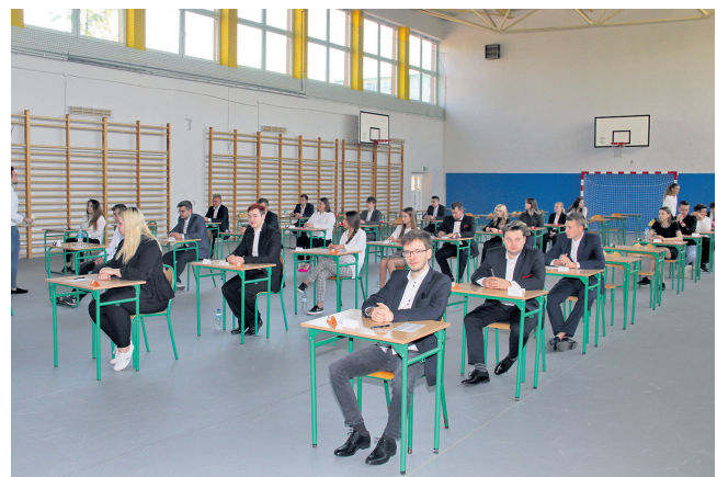
... i w Zespole Szkół Ponadpodstawowych w Brzezinach

Natomiast egzamin dojrzałości w ZSP w Brzezinach, który odbył się sali gimnastycznej i przystąpiło do niego 46 maturzystów. Najchętniej pisanym przedmiotem była historia, natomiast z najmniejszym zainteresowaniem cieszył się język polski