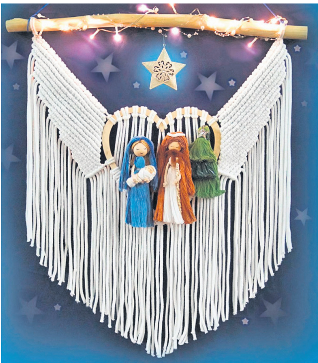
I miejsce – Dom Pomocy Społecznej w Dąbrowie

Nagrodę Publiczności otrzymała Szopka, którą zgłosił do Konkursu Dom Pomocy Społecznej w Radziechowicach. Szopka otrzymała największą liczbę polubień – 325. ■