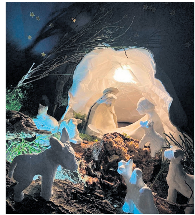
III miejsce – Warsztaty Terapii Zajęciowej w Skierniewicach