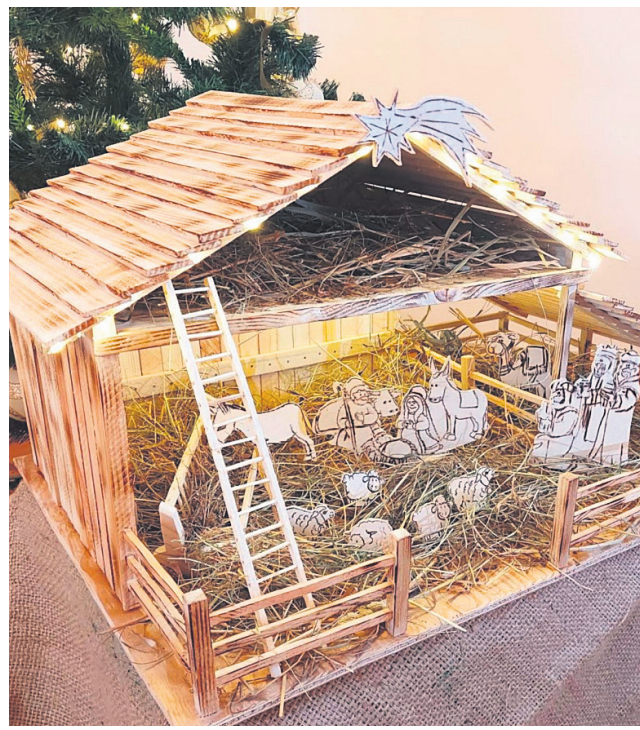
II miejsce – Dom Pomocy Społecznej w Radziechowicach