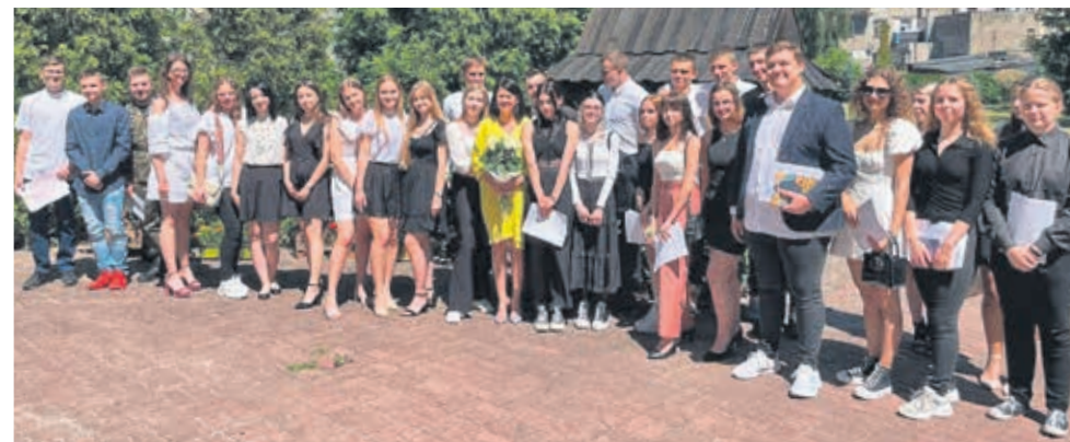
Liceum Ogólnokształcącym im. J. Iwaszkiewicza w Brzezinach

Wszystkim uczniom serdecznie GRATULUJEMY!!! osiągniętych wyników – SŁONECZNYCH WAKACJI życzymy.