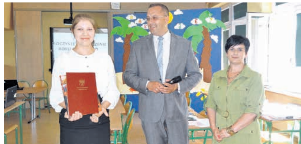
Zespół Szkół Ponadpodstawowych w Brzezinach