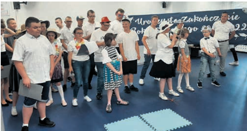
Powiatowy Zespół Szkół i Placówek Oświatowych w Brzezinach