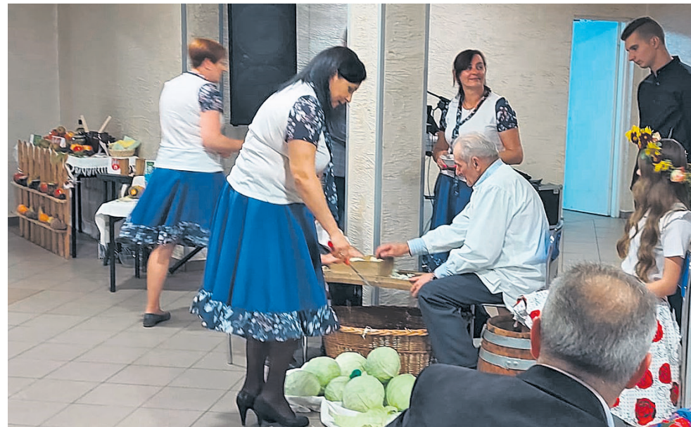
Obrzęd kisenia kapusty