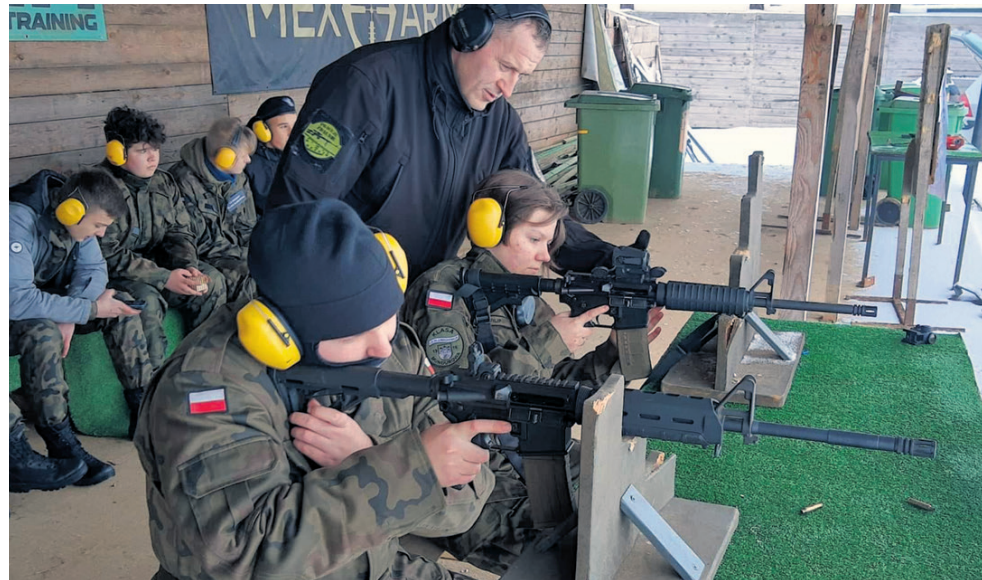
Warsztaty ze strzelectwa sportowego