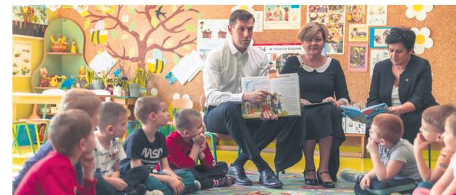
„Czytanie książek to najpiękniejsza zabawa, jaką sobie ludzkość wymyśliła” - W. Szymborska