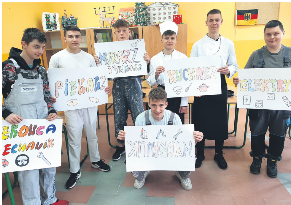
Uczniowie Zespołu Szkół Ponadpodstawowych w Brzezinach

W dniach 30-31 MARCA 2023 ROKU odbyły się dni otwarte w Zespole Szkół Ponadpodstawowych (ZSP) w Brzezinach. Celem wydarzenia było zapoznanie uczniów klas ósmych z okolicznych szkół podstawowych z ofertą edukacyjną ZSP.