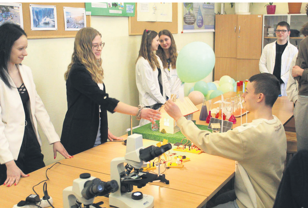
Zajęcia w Liceum Iwaszkiewicza w Brzezinach

Liceum Ogólnokształcące im. J. Iwaszkiewicza: WYSOKI POZIOM nauczania i nowoczesne formy edukacji