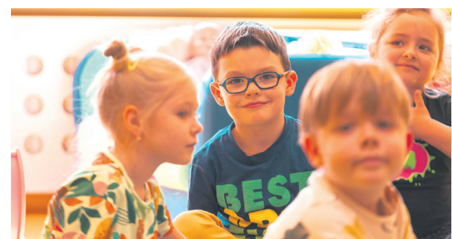
Pierwszego kwietnia 2016 r. uruchomiono program „Rodzina 500+”. Wkrótce pojawiły się również takie programy, jak m.in. „Dobry start”, „Mama 4 plus” i „Rodzinny Kapitał Opiekunczy”.