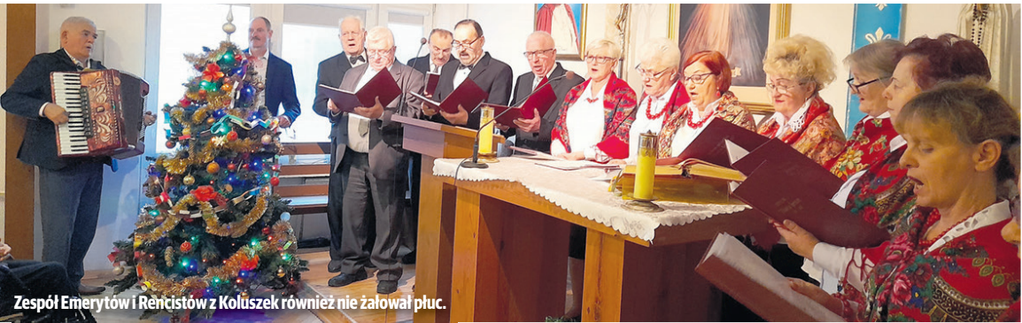
Zespół Emerytów i Rencistów z Koluśzek również nie żałował płuc.