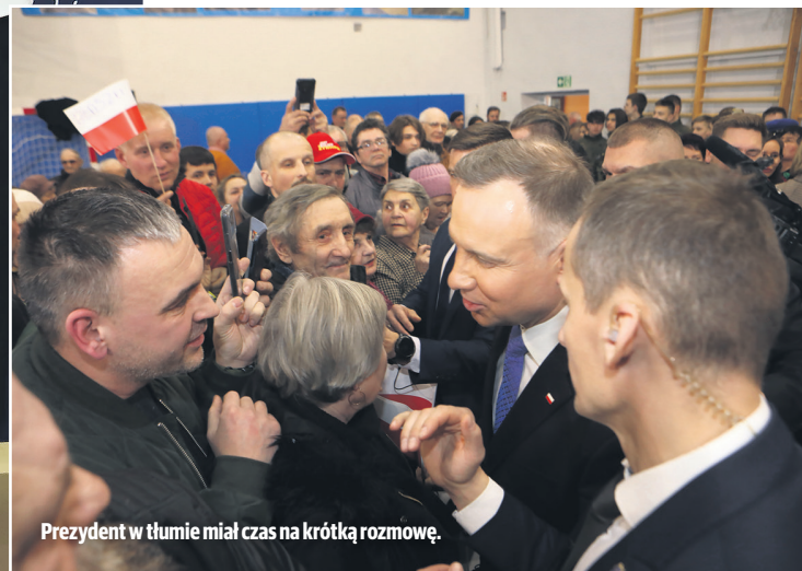
Prezydent w tłumie miał czas na krótką rozmowę.