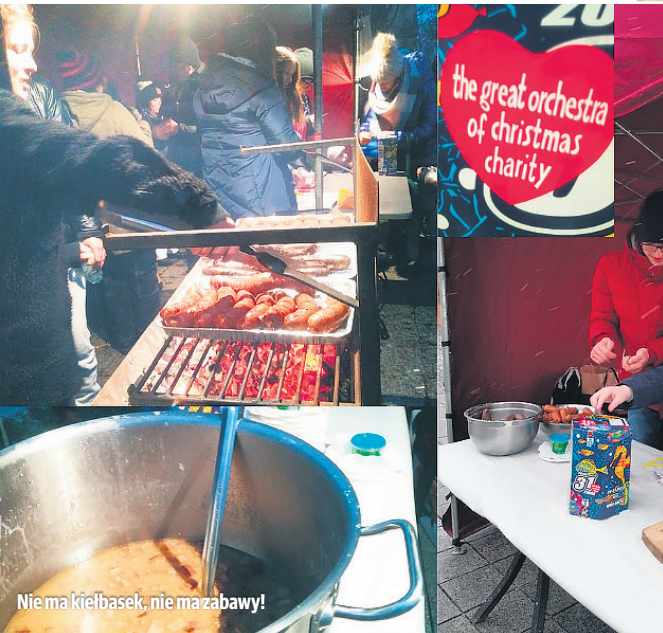
Nie ma kielbasek, nie ma zabawy!