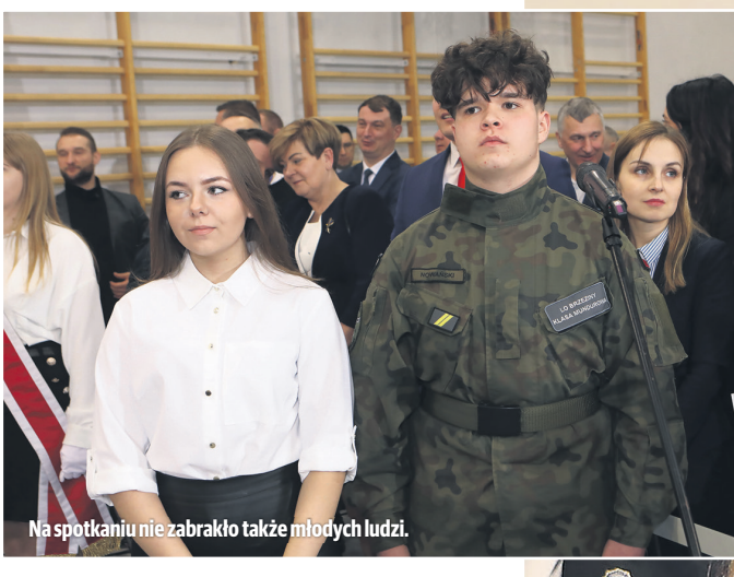
Na spotkaniu nie zabrakło także młodych ludzi.