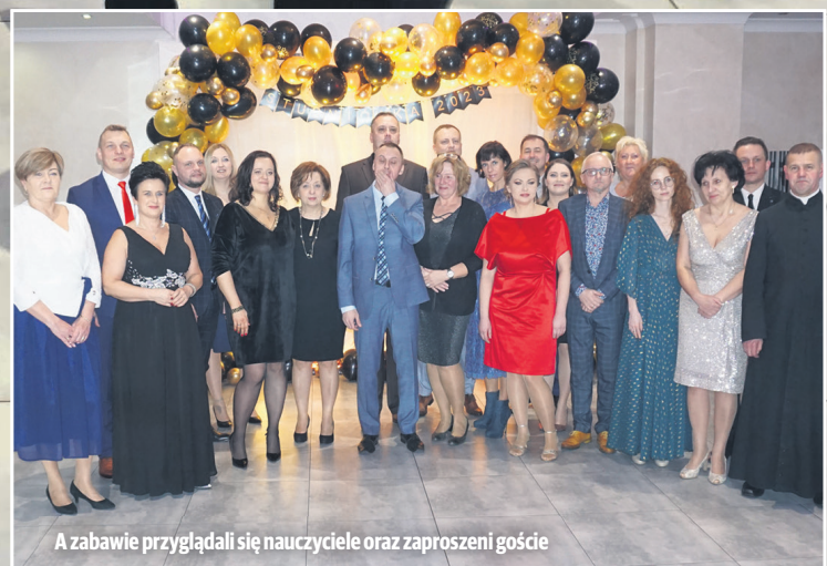
A zabawie przyglądali się nauczyciele oraz zaproszeni goście

T ym razem mieliśmy okazję zawitać do Zespołu Szkół Ponadpodstawowych w Brzeziniach, aby podejrzeć zabawę studniówkową przyszłych maturzystów. Co to dużo pisać, zabawa była absolutnie przednia - zarówno uczniowie, jak i nauczyciele szaleli na parkiecie i to długo. Efekty - zobaczcie na zdjęciach.