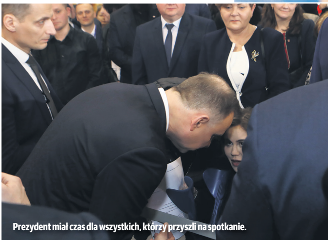
Prezydent miał czas dla wszystkich, którzy przyszli na spotkanie.