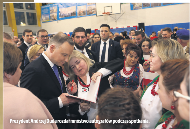
Prezydent Andrzej Duda rozdał mnóstwo autografów podczas spotkania.