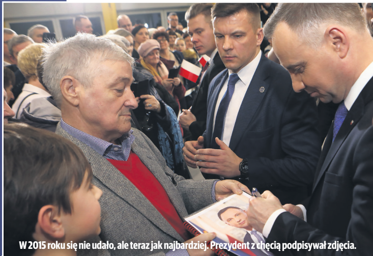
W 2015 roku się nie udało, ale teraz jak najbardziej. Prezydent z chęcią podpisywał zdjęcia.

B ardzo dziękuję za bardzo miłe przyjęcie i ogromnie się cieszę. Być może niektórzy z Państwa pamiętają, że rzeczywiście byłem tu u Państwa, w Brzezinach, prawie osiem lat temu - prawie, bo osiem lat będzie za tydzień, dokładnie 17 lutego - 17 lutego 2015 roku w czasie kampanii prezydenckiej, która wtedy tak naprawdę się zaczynała, gdy bliżej poznawała mnie większość naszych rodaków. Dziękuję, że byli Państwo wtedy ze mną. Są na tej sali osoby, które uczestniczyły w tamtym spotkaniu, które przygotowywały wtedy tę moją wizytę jako kandydata w wyborach, na którego niewielu wtedy stawiało.(...) Tymczasem okazało się, że bardzo wielu ludzi chce, żeby w Polsce doszło do wielkich zmian, że bardzo wielu ludzi chce, żeby Polska zaczęła wyglądać inaczej, żeby podejście ludzi władzy do obywateli było inne, a ja takie właśnie inne podejście proponowałem. Starałem się je realizować przez wszystkie te lata. Dziękuję Państwu z całego serca za poparcie w tamtych wyborach - w 2015 roku. Dziękuję też za poparcie - i tutaj w mieście, w Brzezinach, i w powiecie - również i w wyborach w 2020 roku, gdy ubiegałem się o drugą kadencję - powiedział podczas spotkania prezydent Andrzej Duda.