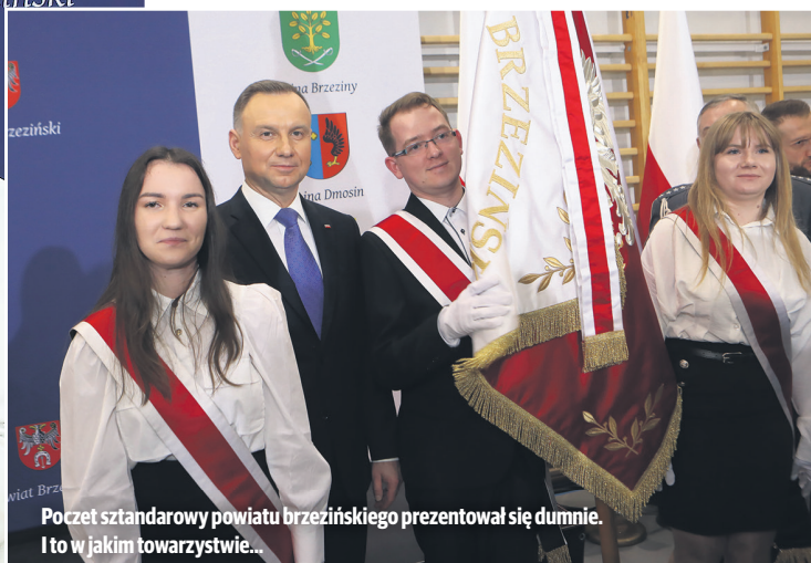
Poczet sztandarowy powiatu brzezińskiego prezentował się dumnie. I to w jakim towarzystwie...