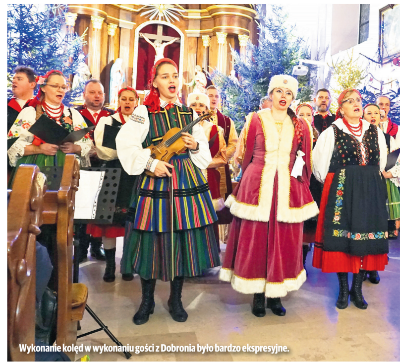
Wykonanie kolęd w wykonaniu gości z Dobronia było bardzo ekspresyjne.