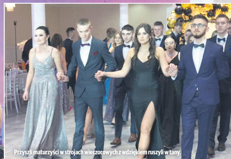
Przyszli maturzyści w strojach wieczorowych z wdziękiem ruszyli w tany.