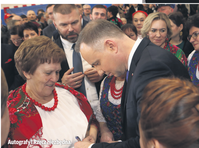
Autografy? Rzecz niezbędna.

N a kilkanaście minut przed spotkaniem z mieszkańcami Andrzej Duda spotkał się z samorządowcami z powiatu, a później przeszedł już do sali, gdzie spotkał się z mieszkańcami.