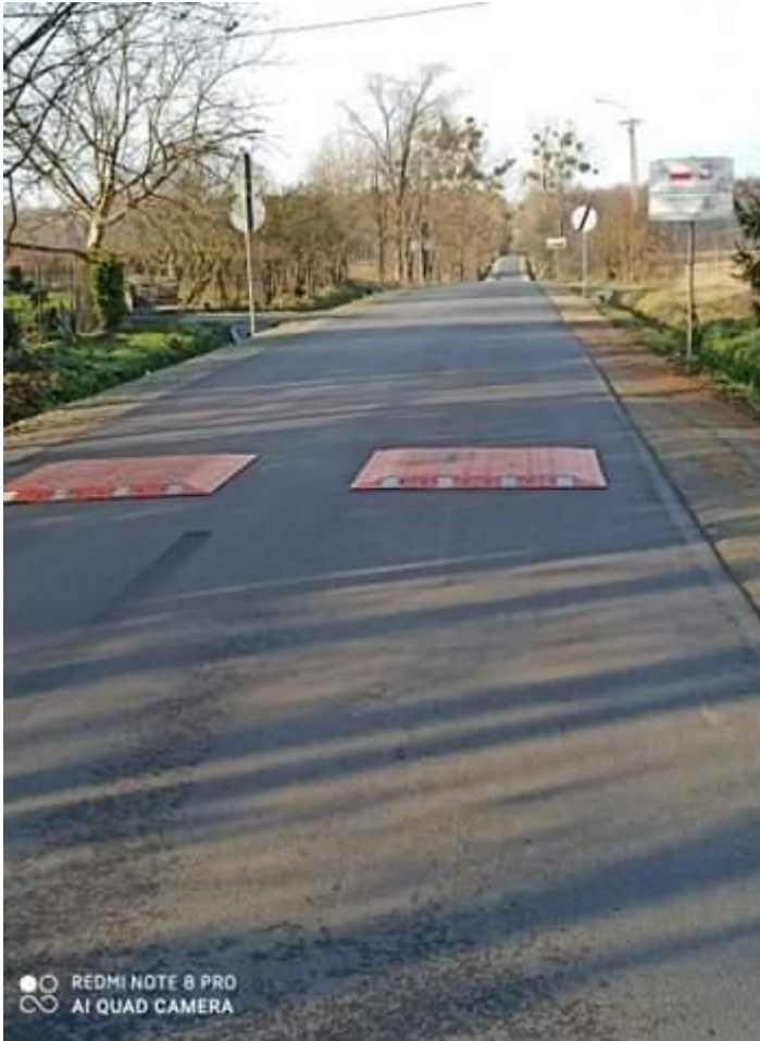
Fot.3. Droga powiatowa Nr 5100 E w miejscowości Brzeziny, ul. Strykowska po przebudowie