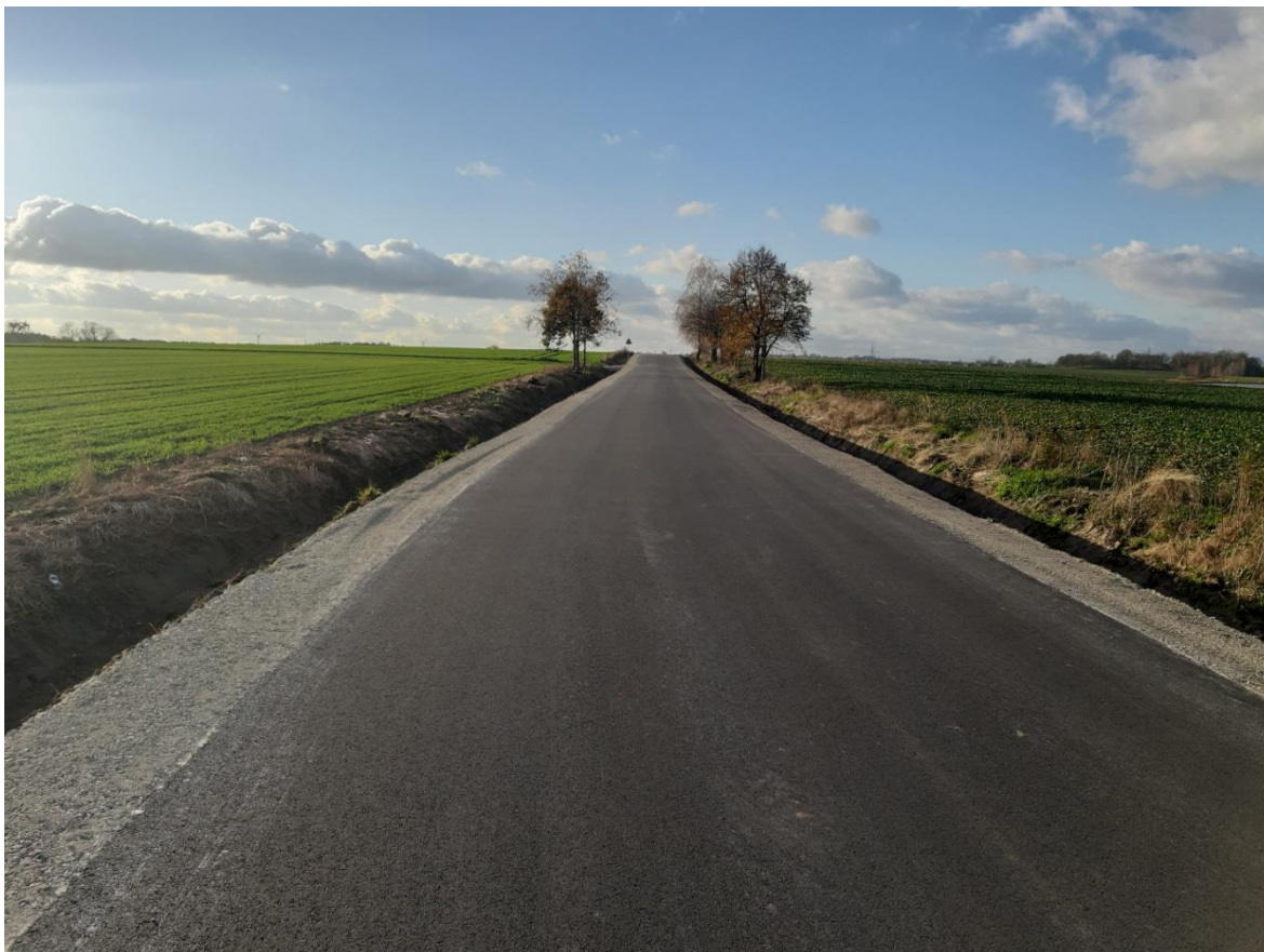
Fot. 5. Droga powiatowa Nr 2918 E w miejscowości Popień po przebudowie

W ramach zadania wykonano remont drogi powiatowej Nr 2918 E w miejscowości Popień na długości 565 mb. Zadanie obejmowało sfrezowanie istniejącej warstwy ścieralnej, wykonanie warstwy wiążącej i warstwy ścieralnej, remont zjazdów indywidualnych w granicach pasa drogowego, wykonanie poboczy o szerokości 0,75 m i grubości 12 cm z kruszyw łamanych, odmulenie rowów z wyprofilowaniem skarp i dna rowu oraz remont przepustu jednootworowego o przekroju kołowym o średnicy DN 1500 mm o długości 10,70 m oraz montaż barier energochłonnych.