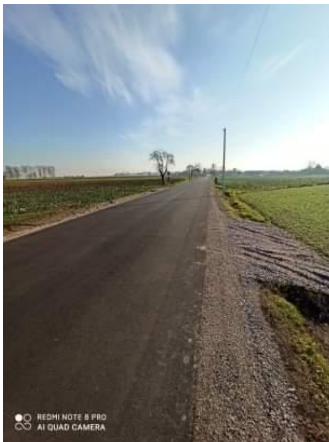
Fot. 12. Droga powiatowa Nr 2934 E po przebudowie