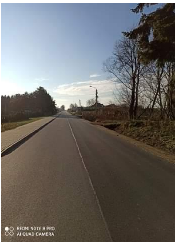
Fot. 14. Droga powiatowa Nr 2912 E w miejscowości Brzeziny, ul. Marczevska po przebudowie