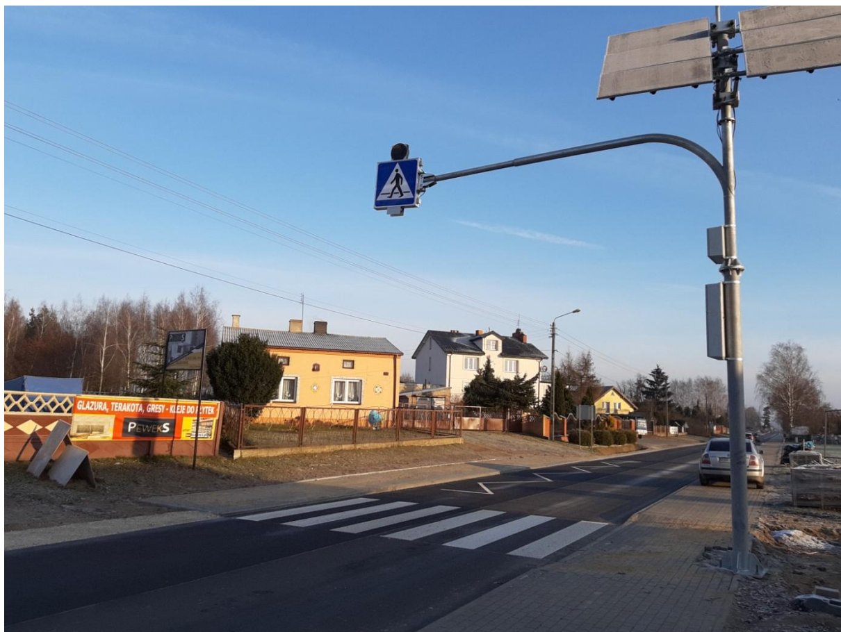
Fot. 15. Droga powiatowa Nr 2912 E w miejscowości Brzeziny, ul. Małczewska po przebudowie

Reasumując w 2020 r. wartość robót budowlanych wyniosła 3.058.738,22 zł . Ogółem koszty niezbędne do zrealizowania inwestycji (roboty budowlane, nadzór inwestorski, tablice informacyjne) wyniosły 3.129.738,97 zł . Łącznie zostało przebudowane i wyremontowane 4640,50 mb dróg powiatowych.