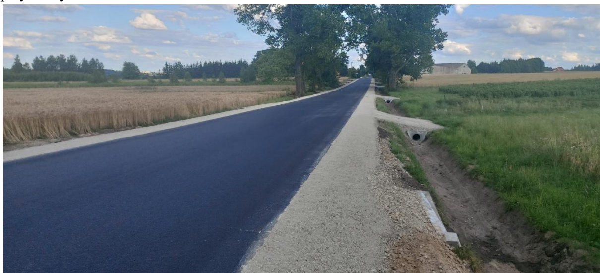
Fot.1. Droga powiatowa Nr 5100 E w miejscowości Brzeziny (ul. Strykowska) po przebudowie

W ramach zadania przebudowana została droga powiatowa Nr 5100 E w miejscowości Brzeziny, ul. Strykowska na długości 590 mb. Zadanie obejmowało rozbiórkę krawędzi nawierzchni jezdni poprzez jej sfrezowanie do podbudowy na szerokości 0,5 m z każdej strony, remont przepustu fi 800 mm, wykonanie poszerzenia jezdni do szerokości 5,5 m (dotyczy warstwy ścieralnej), wbudowanie warstw podbudowy, wbudowanie warstwy wyrównawczej z wyrównaniem spadków poprzecznych, wbudowanie warstwy ścieralnej, wykonanie przebudowy zjazdów indywidualnych w granicach pasa drogowego, wykonanie koryta pod pobocza i wbudowanie poboczy z kruszyw łamanych oraz oczyszczenie rowów przydrożnych.