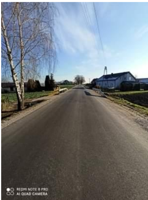
Fot. 11. Droga powiatowa Nr 2934 E w miejscowości Popień po przebudowie