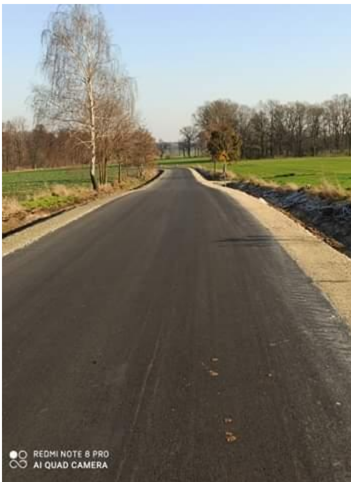
Fot. 8. Droga powiatowa Nr 2918 E w miejscowości Popień po przebudowie