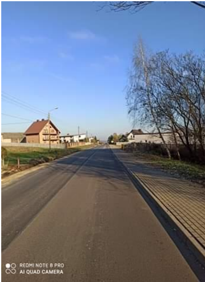
Fot. 13. Droga powiatowa Nr 2912 E w miejscowości Brzeziny, ul. Małczewska po przebudowie