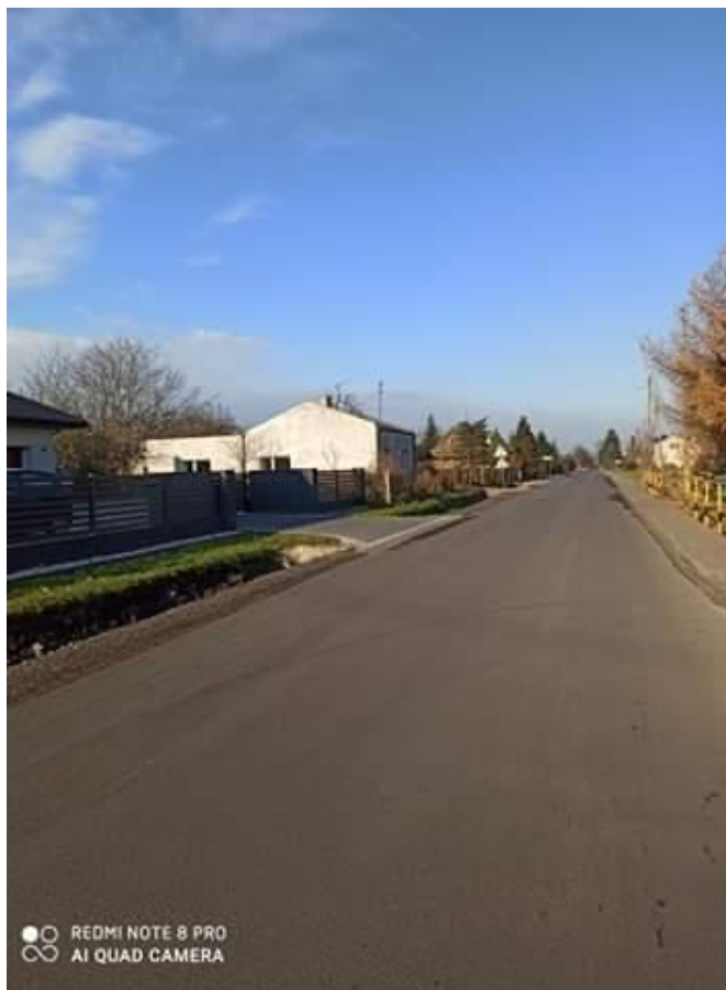
Fot. 9. Droga powiatowa Nr 2940 E w miejscowości Józefów po remoncie

indywidualnych w granicach pasa drogowego, wykonanie poboczy o szerokości 0,75 m i grubości 12 cm z kruszyw łamanych, odmulenie rowów z wyprofilowaniem skarp i dna rowu.