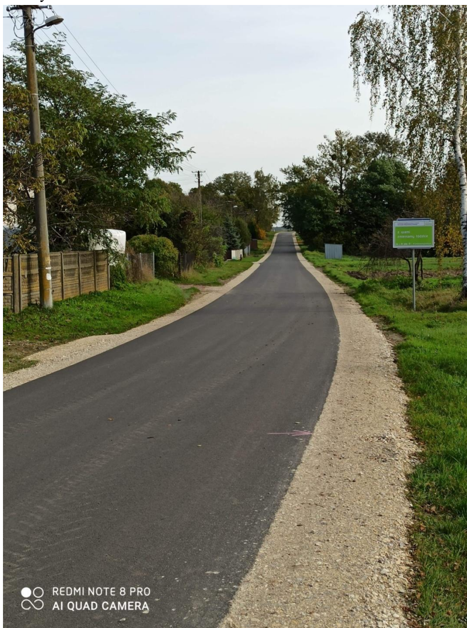
Fot. 4. Droga powiatowa Nr 2917 E w miejscowości Kędziorki po remoncie

W ramach zadania wykonano remont drogi powiatowej Nr 2917 E w miejscowości Kędziorki na długości 750 mb. Zadanie obejmowało sfrezowanie korekcje istniejącej warstwy ścieralnej, wykonanie warstwy wiążącej o gr 5 cm oraz warstwy ścieralnej o gr 4 cm, wykonanie poboczy o szerokości 0,75 m i grubości 12 cm z kruszyw łamanych.