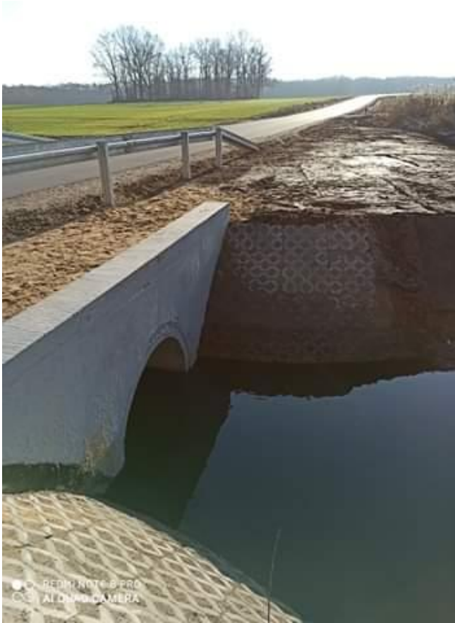
Fot. 6. Droga powiatowa Nr 2918 E w miejscowości Popień po przebudowie