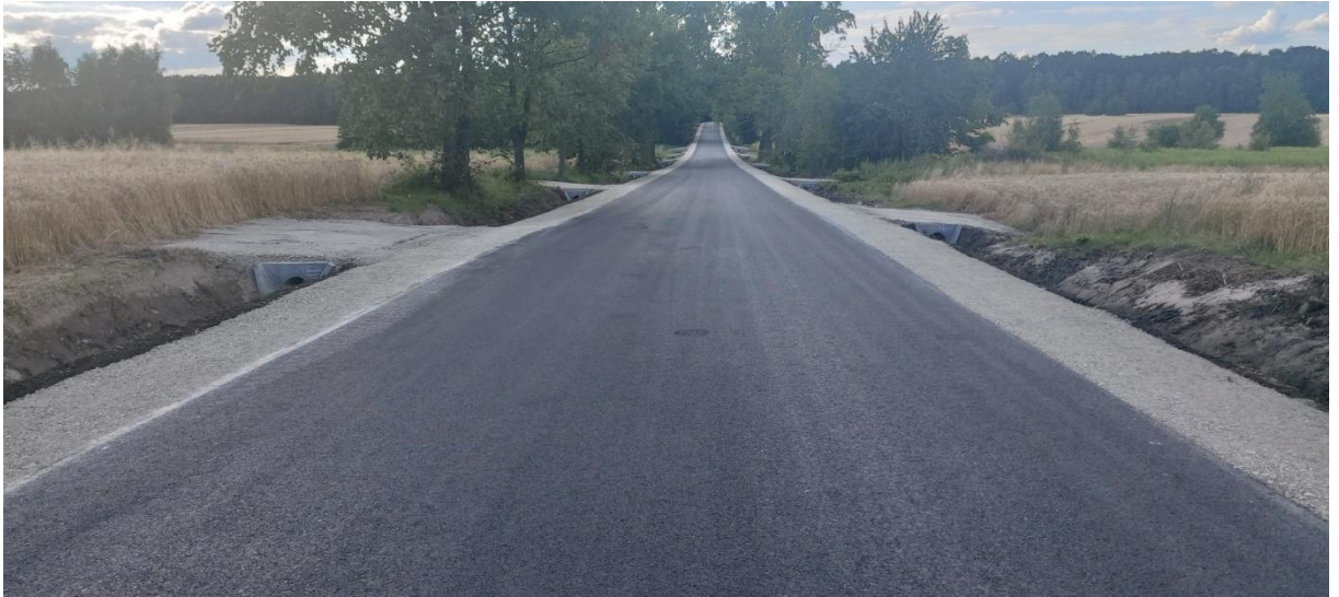
Fot.2. Droga powiatowa Nr 5100 E w miejscowości Brzeziny (ul. Strykowska) po przebudowie