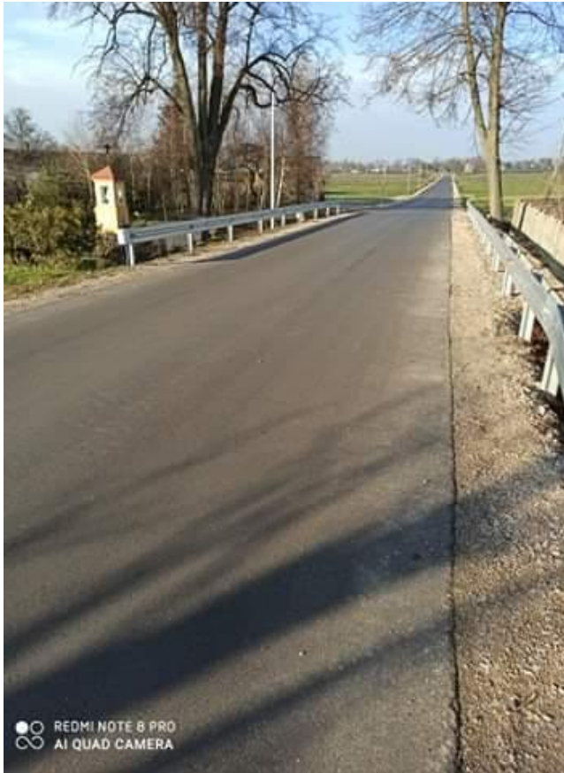
Fot. 10. Droga powiatowa Nr 2934 E w miejscowości Popień po przebudowie

z wyrównaniem spadków poprzecznych, wbudowanie warstwy ścieralnej, wykonanie przebudowy zjazdów indywidualnych w granicach pasa drogowego, wykonanie koryta pod pobocza i wbudowanie poboczy z kruszyw łamanych o szerokości 0,75 m i grubości 15 cm oraz oczyszczenie rowów przydrożnych.